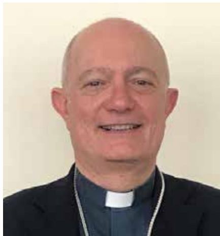
Mons. Andrea Bellandi

L'Ufficio Catechistico Regionale prosegue i suoi incontri dopo la nomina del neodirettore don Salvatore Soreca, ufficializzata nel precedente incontro del 15 marzo, svoltosi a Pompei. Da quel primo incontro, nato anche dall'esigenza di programmare i lavori del prossimo quadriennio, erano emerse alcune questioni ritenute dai partecipanti fondamentali per l'organizzazione della trasmissione della fede in un tempo in cui l'uomo e la società evolvono sempre più velocemente, questioni che sono state argomento centrale di questo secondo incontro, nel quale sono state oggetto di studio e hanno fatto da guida per la programmazione. L'incontro si è svolto mercoledì 7 giugno scorso, presso il Centro "La Pace", una accogliente struttura immersa nel verde