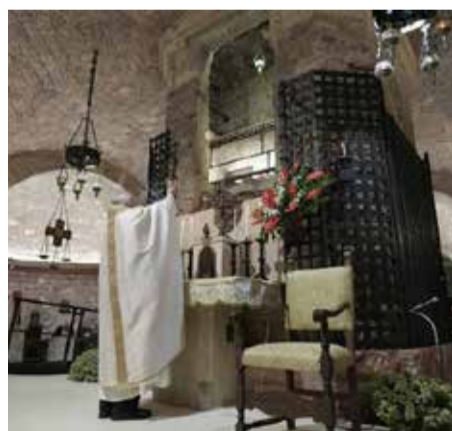
SS. Francesco - Sacro Convento di Assisi - Celebrazione della Santa Messa e firma dell’Enciclica “Fratelli tutti” alla tomba di San Francesco - 03/10/2020