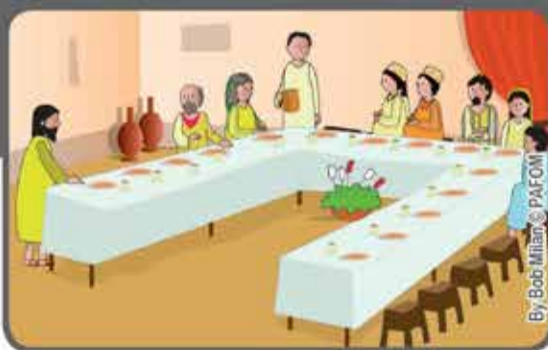
Se sei invitato da qualcuno a un pranzo di nozze, non sederti ai primi posti, metti invece all'ultimo posto.