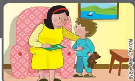
Poi torna a darle un bacio e le dice: "Mamma, offri questa stanchezza a Gesù; anch'io prima non avevo voglia di fare i compiti, ma poi ci ho ripensato e li ho fatti".