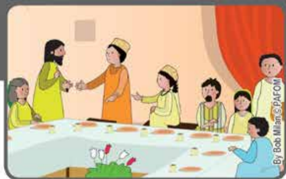
Quando arriverà chi ti ha invitato, ti dirà: "Amico passa più avanti" e tu ne sarai felice. (cfr. Lc 14,8-10).