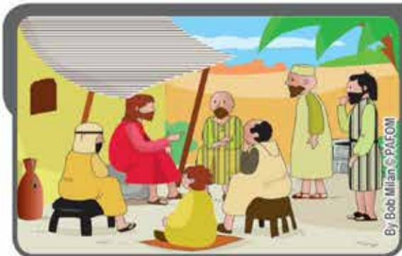
Gesù, pur essendo Dio, ha scelto di mettersi al servizio di tutti. Anche ai suoi discepoli raccomanda di essere umili e fa un esempio.

Leggi da solo, o con un adulto, il fumetto del mese. Le bellissime vignette colorate ti aiuteranno a capire meglio ciò che c'è scritto.