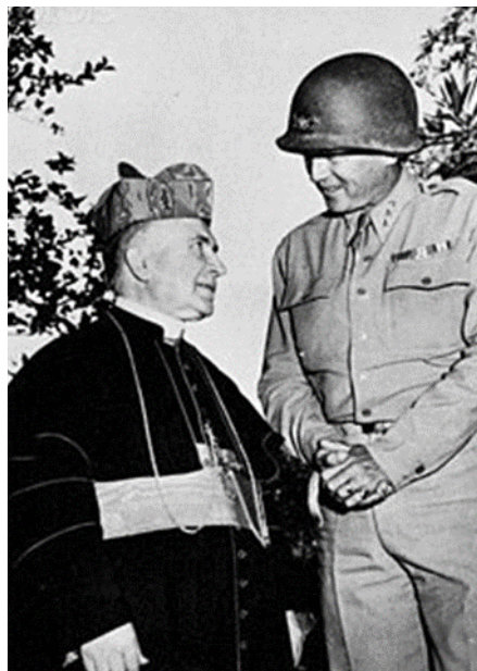
Il Card. Lavitrano e il generale Patton il 18 agosto del '43

«Quello stesso giorno, a Castel Gandolfo, il Cardinale Lavitrano tornò alla casa del padre, si spese fino alla fine per onorare il suo motto episcopale "Per Crucem ad astra", che interpreta anche la spiritualità dell'Opera, la strada verso la santità passa attraverso le spine del quotidiano, vissuta con fede e amore».